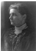
Foto 1 : Jane Addams (1860-1935)

Pochi sanno che, nel 1931, ad una delle pioniere della professione di Assistente Sociale, Jane Addams, è stato riconosciuto il Premio Nobel per la Pace.